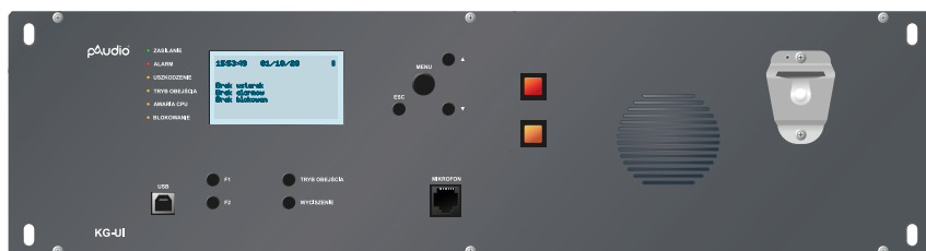
SYSTEM DSO IVO